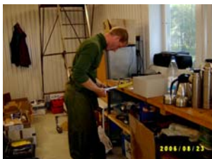
Även reparationer förekom i delar av restaurangen. Hkp-mekaniker lagar rotordetalj.