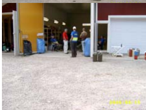
Räddningsverkets personal orienteras.