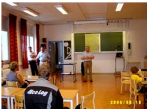
Fredag 2006-08-18 Kommunledningen och Räddningschefen informerar i Harads skola