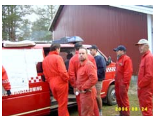
Gunnarsbyns brandmän får information