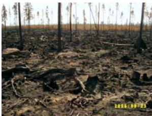
Brandskador i skogen