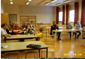
FRG ordnar lokal och service i Harads skola Drabbade skogsägare lyssnar.