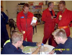
Brandmän från Lycksele Räddningstjänst