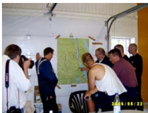
Brandmän från STORUMAN informeras