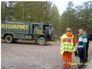
F 21 får informationer och direktiv av Göran