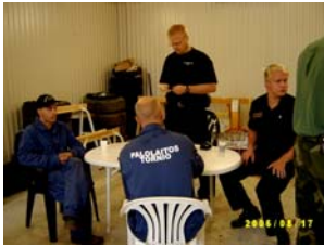
Brandmän från Torneå utspisas