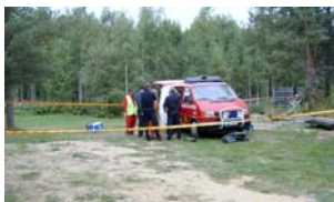
Ledningscentralen i Västbo måndagmorrn 2006-08-14. Info och ordergivning.