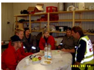
Här får Vuollerims brandmän info från Insatschefen