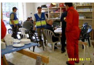
Trötta brandmän får vänligt mottagande av FRG Kalix