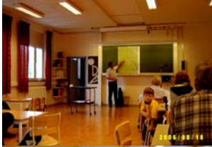
Räddningschefen visar katastrofområdet