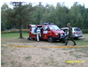
Arbete vid Ledningsbussen