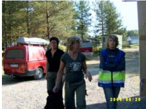
FRG från Älvsbyn avlöser