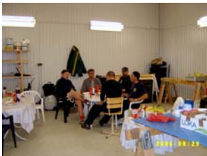
Piteå Räddningstjänst brandmän i vila