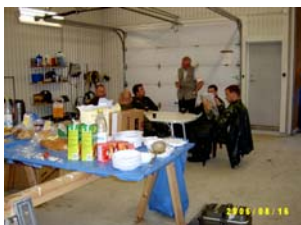
Flygbesättningar får mat, frågor och information