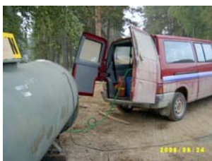
FRG bemannade. Tankning av bilar och motorsprutor