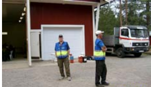
FRG väntar på att få tanka upp.