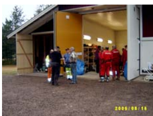
Maskinförare till skogsmaskiner och traktorer får information