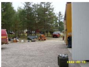
Materielplatsen utanför restaurangen "Brända Skogen"