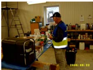
FRG förbereder utspisningen