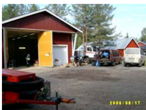
Sopstationens sopor bortforslas