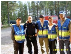
Polisen kommer på besök