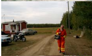
PRESSEN började anlända . Här en fotograf från RÄDDNINGSVERKET: