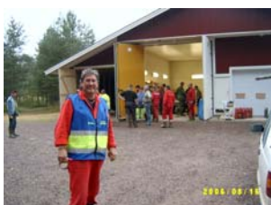
FRG-are i arbete. Glad och positiv