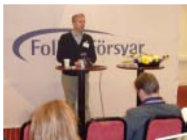
Försvarsminister Sten Tolgfors (M) försvarade värnpliktens avskaffande.