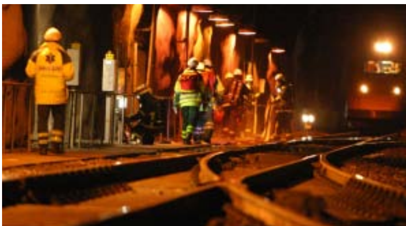
Räddningstjänsten och sjukvårdare begav sig till tåget. Slangar anslöts till en brandpost.