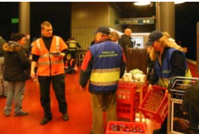
FRG hade full koll på logistiken och såg till att alla fick något i magen innan det var dags att åka hem.

Sigtuna, deltog i ett planeringsmöte ungefär en vecka innan själva övningen. Den elfte december, när övningen genomfördes, möttes FRG-teamet upp i Kårsta öster om Arlanda flygplats. Sex personer fick skjuts till flygplatsen för att åka till Stockholm central med Arlanda Express och vara med på övningståget. Tillsammans med andra, bland