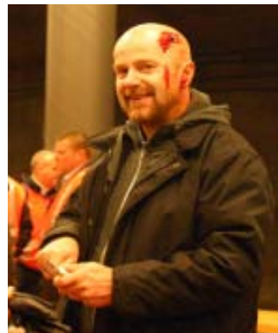
En av de anställda på Arlanda Express som dagen till ära agerade skadad.