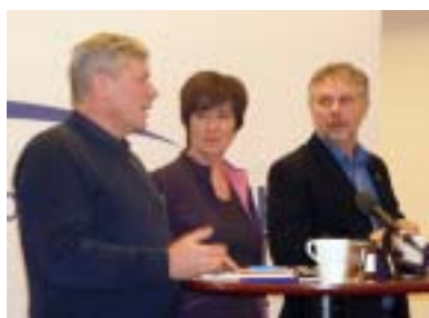
Partiledarna Lars Ohly (V) och Mona Sahlin (S) samt språkröret Peter Eriksson (MP).