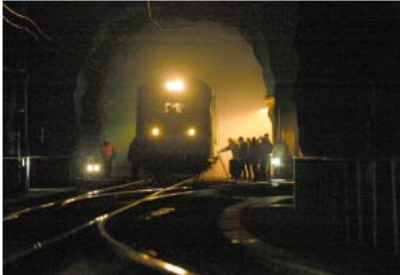
Efter bromsproblem spårade Arlanda Express ur strax innan Arlanda Södra. Evakuering påbörjades. Tågets belysning gick över i nödläge och signalerade med blinkande sken.