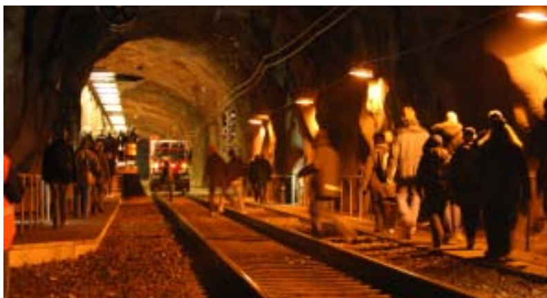
De av passagerarna som kunde begav sig mot perrongen där de togs om hand av sjukvårdspersonal och polis. I bakgrunden bandvagnen från Hägglunds.