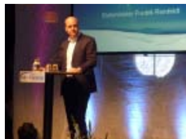
Statsminister Fredrik Reinfeldt (M) lade fokus på erfarenheterna från ordförandeskapet i EU.