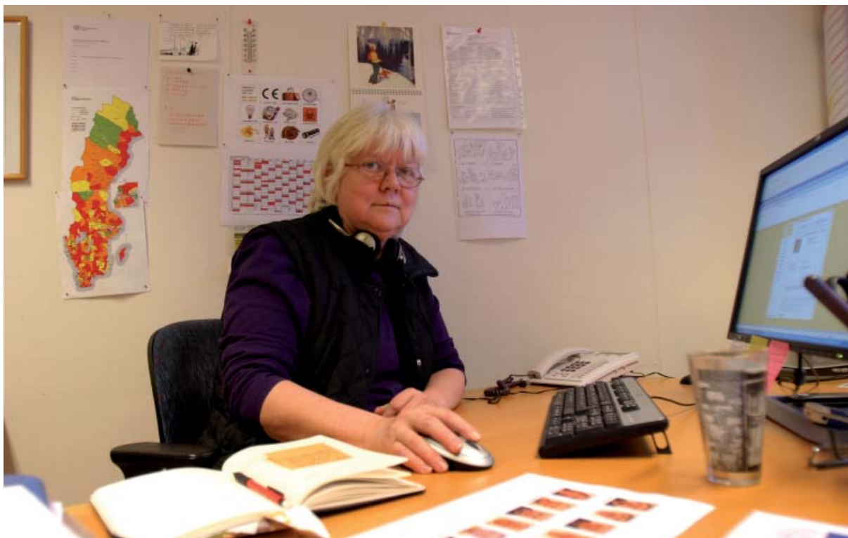
Förbundets webbredaktör Gunlög Solax har hållit i trådarna under utvecklingen av den nya webben.