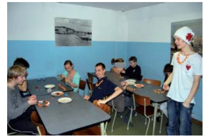
Ungdomarna sätter ihop energihalsband att hänga runt halsen. När krafterna tryter är det bara att ta ett bitt.