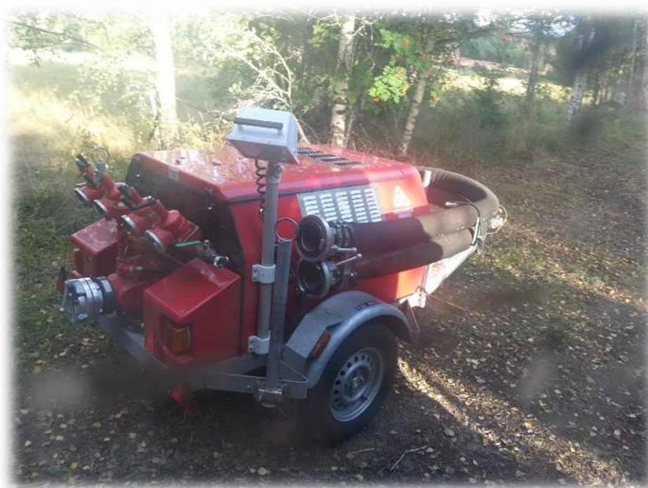
Moterspruta – en del av den brandbekämpningsutrustning som skulle registreras i fält.