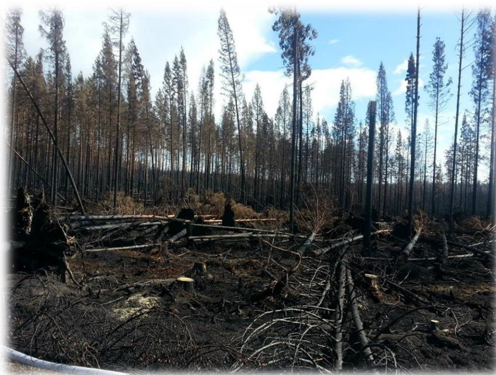
Stor förödelse i brandområdet.