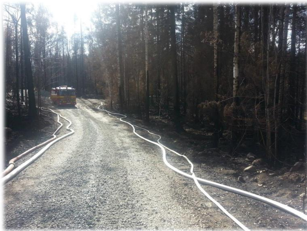
Räddningstjänsten hade lagt ut enorma mängder slang under området. En del av FRG:s uppgift var att logga sträckorna och släcksystem geografiskt.